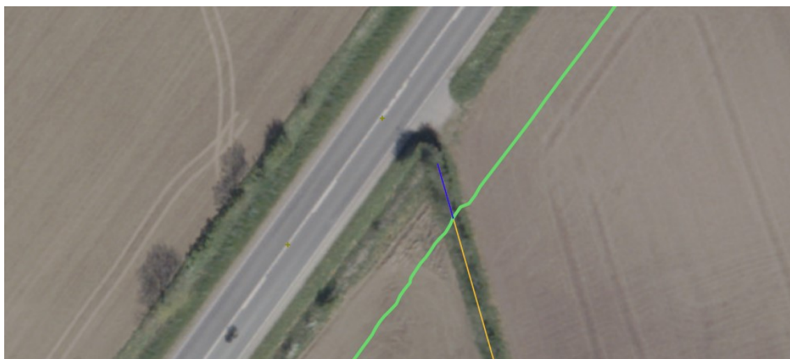
Figur 4: Luftfoto fra foråret 2023, der viser den østlige afgrænsning af cykelstien med grønt, beskyttede sten- og jorddiger med gult og påvirkede dele af beskyttede sten- og jorddiger med blåt.

Diget er beliggende på matr.nr. 10 Grønnebæk, Jels. De nordligste ca. 7 meter af diget skal nedlægges.