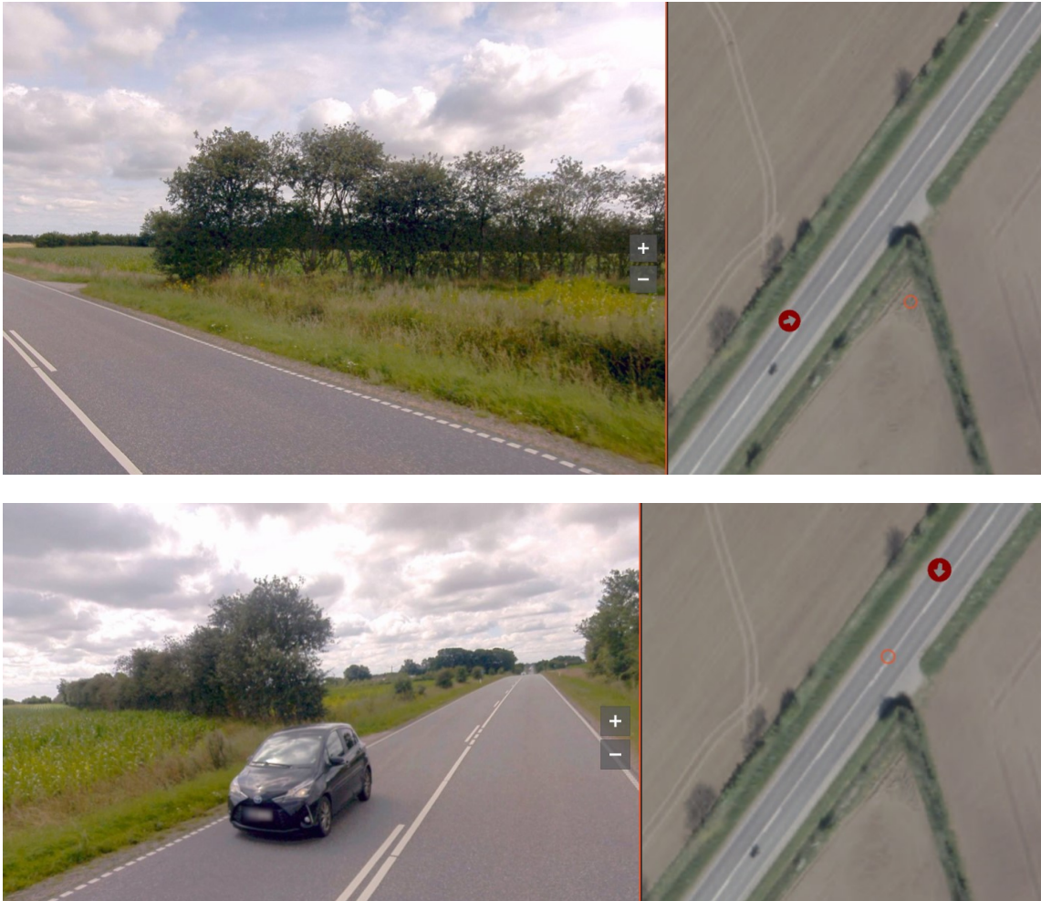
Figur 5: Gedefotos, der viser diget, samt placering af fotopunkt og -retning, både fra nord og syd.