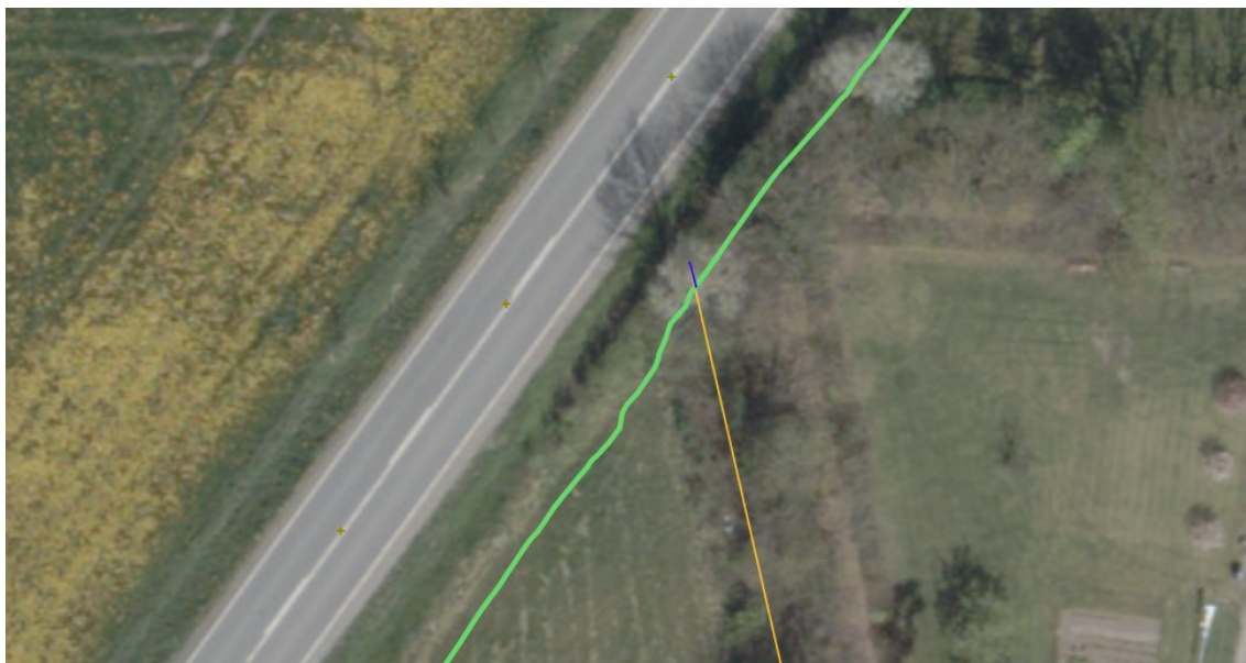
Figur 6: Luftfoto fra foråret 2023, der viser den østlige afgrænsning af cykelstien med grønt, beskyttede sten- og jorddiger med gult og påvirkede dele af beskyttede sten- og jorddiger med blå.

Diget er et jorddige med flere gamle træer. Heriblandt træer, der er egnede levesteder for flagermus. For at tage hensyn til dette, er der foretaget projektilpasninger, så diget berøres mindst muligt. Derved undgås bl.a. fældning af et gammelt træ 7-8 meter fra vejen, som ved forundersøgelserne til projektet blev vurderet som egnet levested for flagermus 2 .