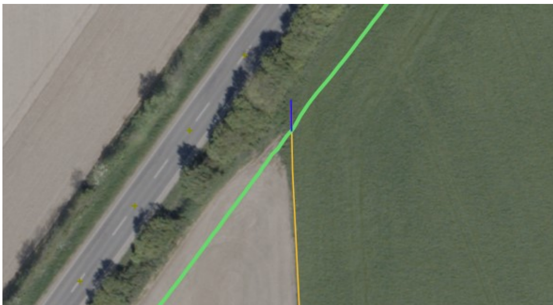
Figur 2: Luftfoto fra foråret 2023, der viser den østlige afgrænsning af cykelstien med grønt, beskyttede sten- og jorddiger med gult og påvirkede dele af beskyttede sten- og jorddiger med blå.

Diget er beliggende i skel mellem matr.nr. 341 Grønnebæk, Jels og matr.nr. 318 Grønnebæk, Jels. De nordligste ca. 7 meter af diget nedlægges.