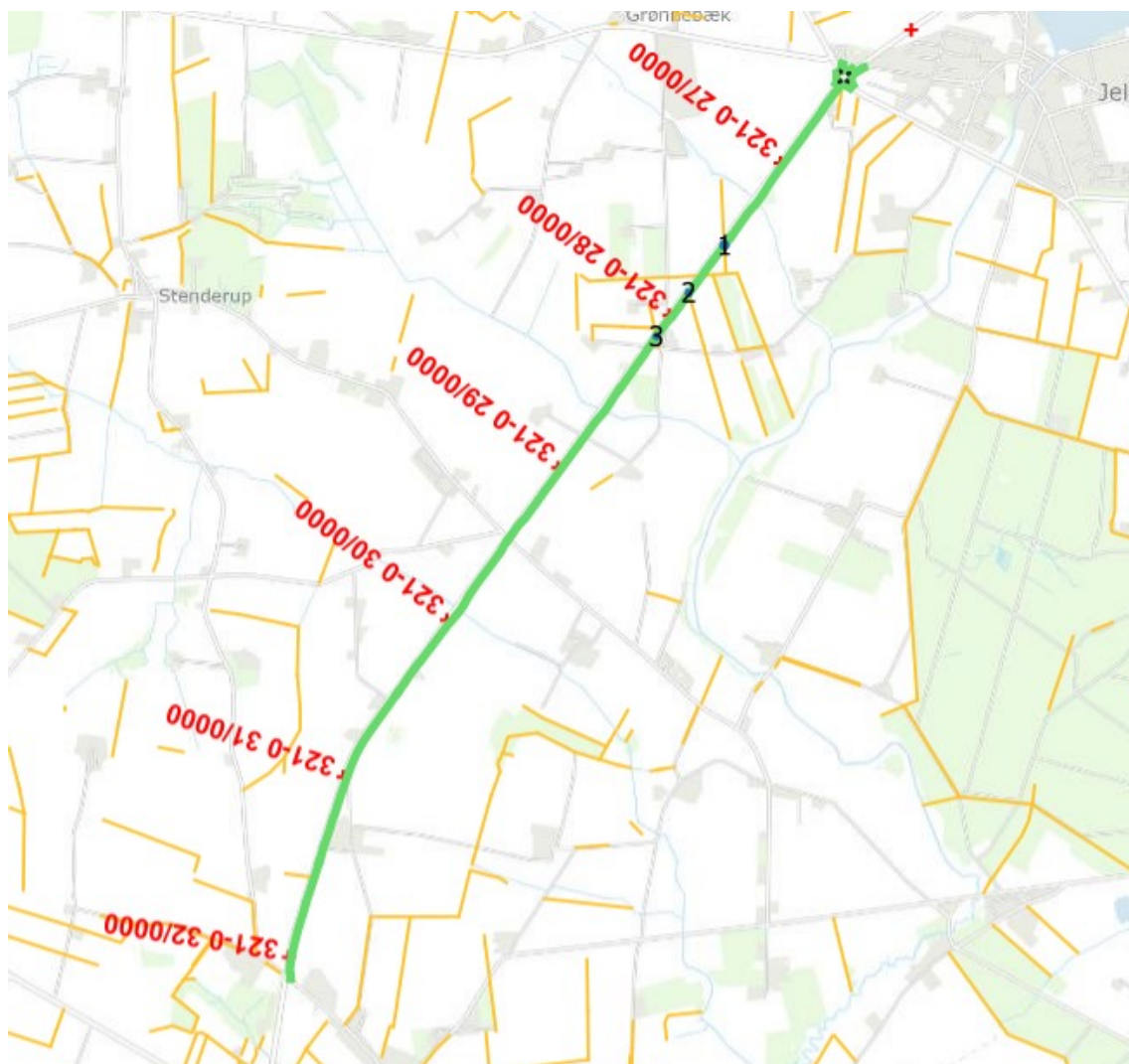
Figur 1: Oversigtskort, der viser hele tracéet for cykelstien med grønt, beskyttede sten- og jorddiger med gult og placering af de påvirkede diger med tallene 1-3.

Mere information om projektet, samt forskellige baggrundsrapporter, kan ses på Etablering af cykelsti mellem Jels og Øster Lindet.