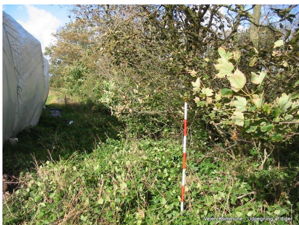
Figur 3: Dige nr. 3 – BD101.866 besøgt den 6. oktober 2004