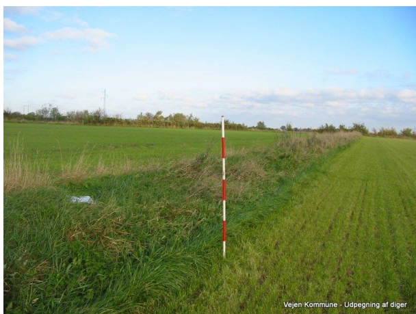
Figur 1: Dige nr. 1 – BD101.864 besigtiget den 12. oktober 2004

Diget er besigtiget af Sønderjyllands Amt i 2004, og er et jorddige, 0,25-0,50 meter højt og 2,0-2,5 meter bredt. Diget er et udskiftningsdige med kulturhistorisk værdi, og det kan dateres til mellem år 1764 og 1820.