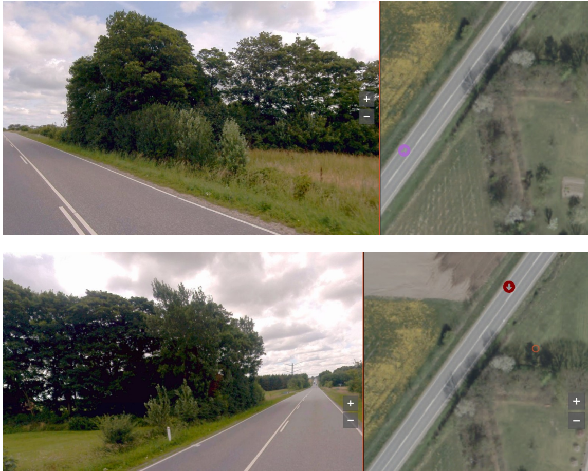
Figur 7: Gedefotos, der viser diget, samt placering af fotopunkt og -retning, både fra nord og syd.