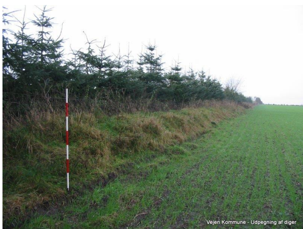
Figur 2: Dige nr.2 – BD101.869 besigtiget den 12. oktober 2004

Diget er besigtiget af Sønderjyllands Amt i 2004, og er et jorddige, 0,50-0,75 meter højt og 2,0-2,5 meter bredt. Diget er et udskiftningsdige med kulturhistorisk og landskabelig værdi, og det kan dateres til mellem år 1764 og 1820.